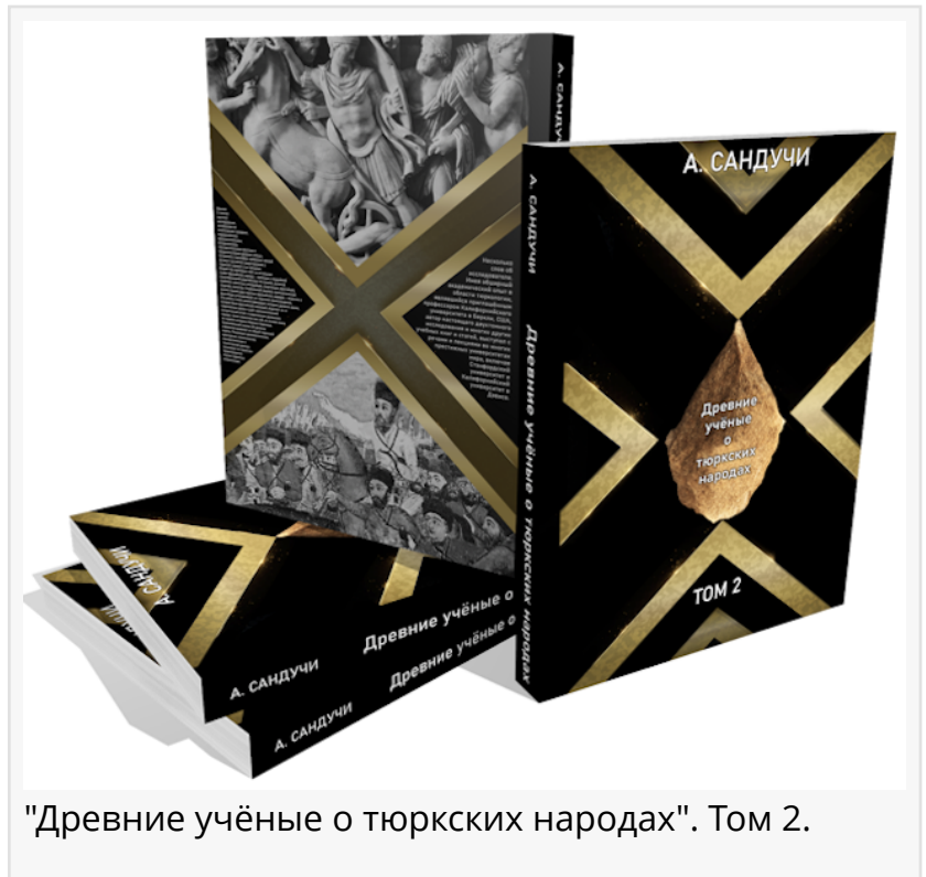
"Древние учёные о тюркских народах". Том 2.

Преимущественно основываясь на генетических исследованиях, подкреплённых археологическими, историческими, лингвистическими фактами и свидетельствами древних учёных, историков и географов, эта научная работа раскрывает новые свидетельства о библейском происхождении тюркских народов, которые были связаны