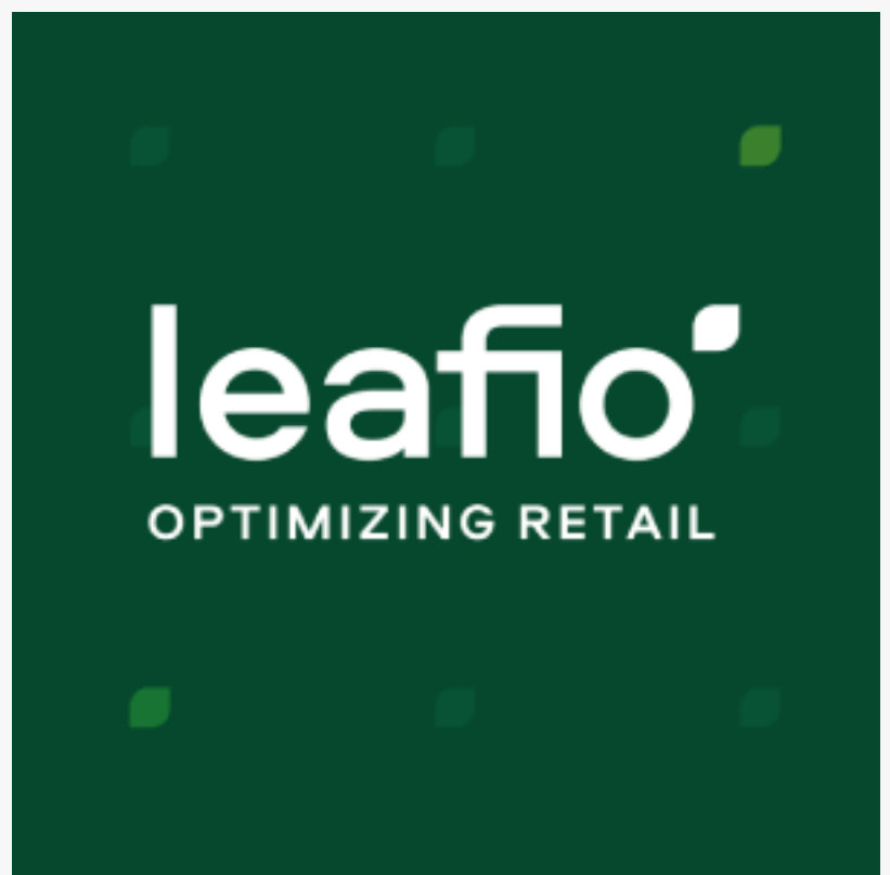
Leafio IA Soluções automatizadas de varejo

A Plataforma de IA da LEAFIO é uma solução de alta tecnologia baseada em machine learning que permite que você automatize completamente a gestão de estoque da sua rede, otimizando e gerenciando