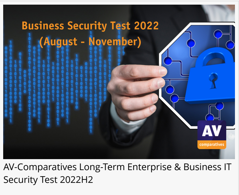
AV-Comparatives Long-Term Enterprise & Business IT Security Test 2022H2

https://www.av-comparatives.org/de/tests/business-security-test-2022-august-november