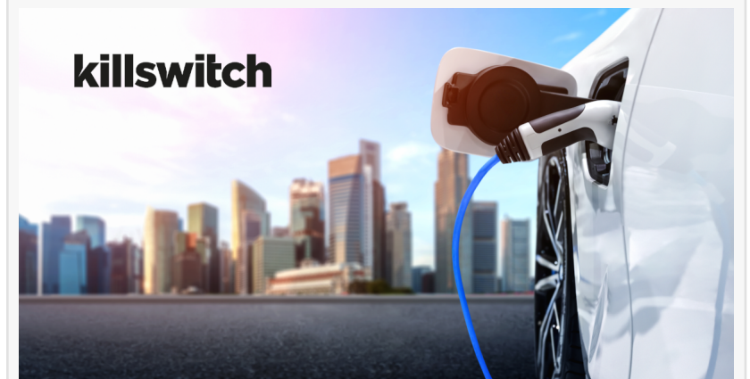
Payment System for EV Chargers

This press release can be viewed online at: https://www.einpresswire.com/article/608441220