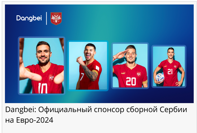
Dangbei: Официальный спонсор сборной Сербии на Евро-2024