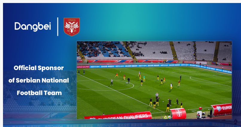
Dangbei выступит на Евро-2024

По словам г-на Сюя, генерального менеджера зарубежного бизнеса Dong bei, "Мы гордимся тем, что поддерживаем сборную Сербии по футболу на Евро-2024. Наша миссия - предоставить нашим клиентам экстраординарный аудиовизуальный опыт на больших экранах, и мы рады поделиться этим опытом с поклонниками прекрасной игры по всему миру".