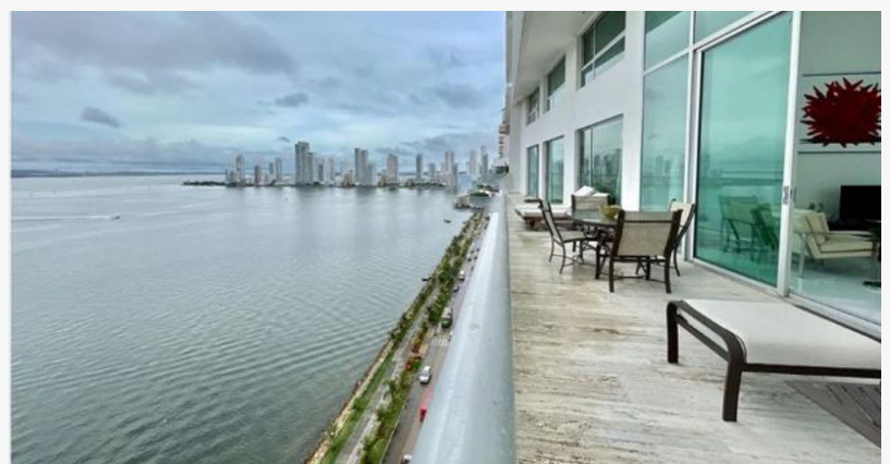
Apartamento turístico para plataformas