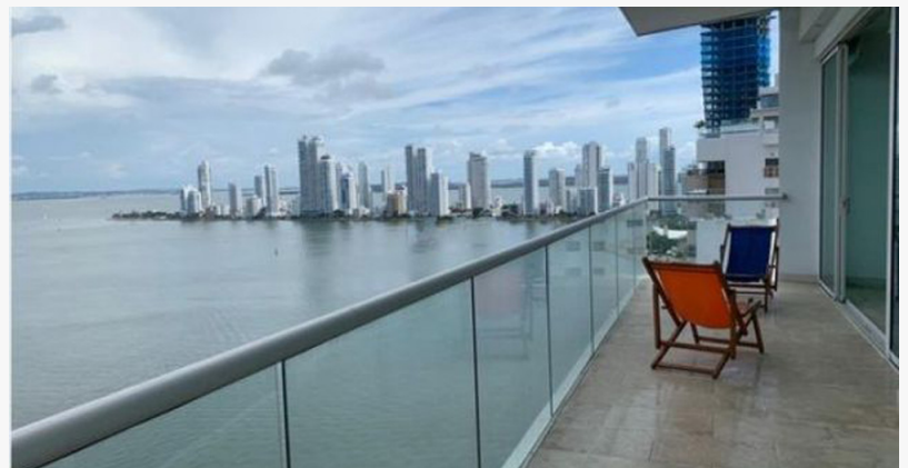
Apartamentos turísticos en Bocagrande