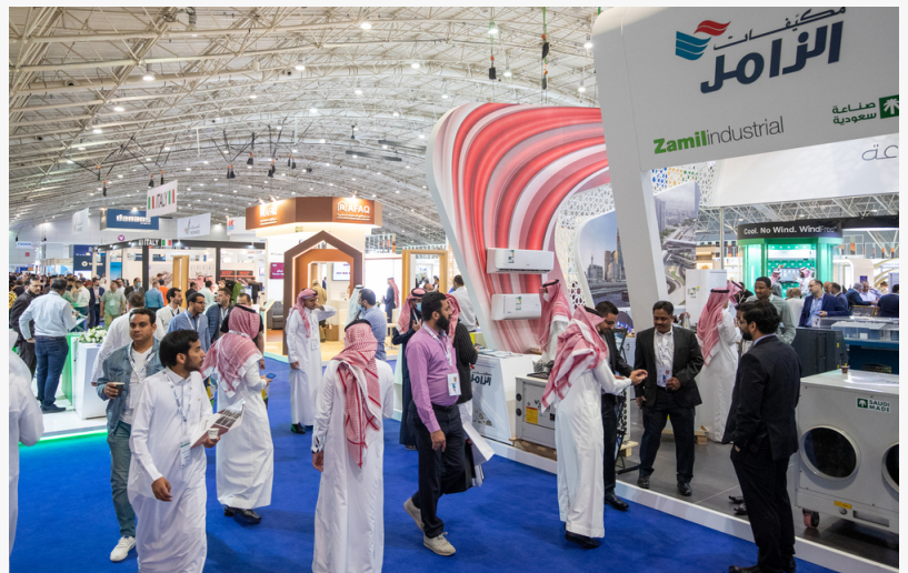
dmg events launches Saudi Hospital Design&Build Expo

DMG Events is a leading provider of tailored solutions for its clients in the Middle East. The company has a proven track record of organizing high-quality, tailored events for a wide range of industries. The Saudi Hospital Design&Build Expo is a key event in the region's healthcare sector, providing a platform for industry leaders to share their expertise and collaborate on future projects. The event is also aligned with the Kingdom's 2030 Vision, which aims to transform the healthcare sector into a leading global hub. The expo will showcase the latest technologies and innovations in hospital design and construction, including digital health, artificial intelligence, and sustainable building. It will also provide a platform for industry leaders to discuss the challenges and opportunities facing the sector. The event is expected to be a major success, providing a valuable opportunity for industry professionals to connect and collaborate.