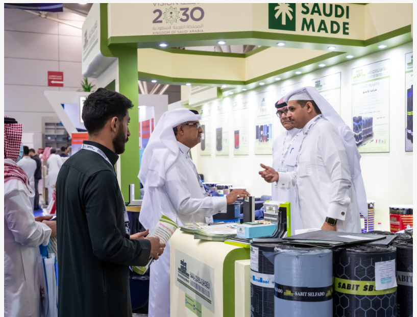
Aligned with the Kingdom's 2030 Vision, the upcoming annual event will help futureproof the country's healthcare

DMG Events is a leading provider of tailored solutions for its clients in the Middle East. The company has a proven track record of organizing high-quality, tailored events for a wide range of industries. The Saudi Hospital Design&Build Expo is a key event in the region's healthcare sector, providing a platform for industry leaders to share their expertise and collaborate on future projects. The event is also aligned with the Kingdom's 2030 Vision, which aims to transform the healthcare sector into a leading global hub. The expo will showcase the latest technologies and innovations in hospital design and construction, including digital health, artificial intelligence, and sustainable building. It will also provide a platform for industry leaders to discuss the challenges and opportunities facing the sector. The event is expected to be a major success, providing a valuable opportunity for industry professionals to connect and collaborate.