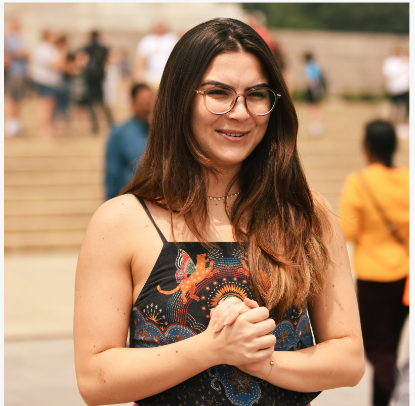
lado international institute