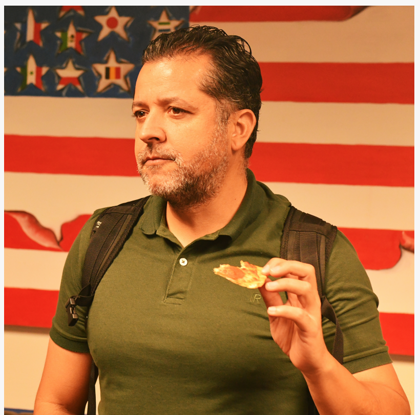
lado international institute

This press release can be viewed online at: https://www.einpresswire.com/article/642405690