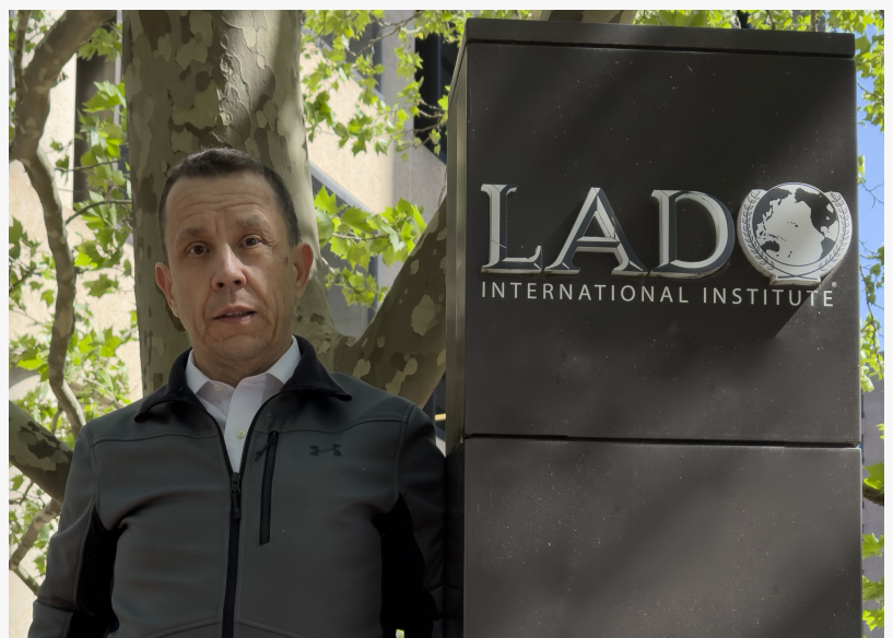
CEO LADO INTERNATIONAL INSTITUTE