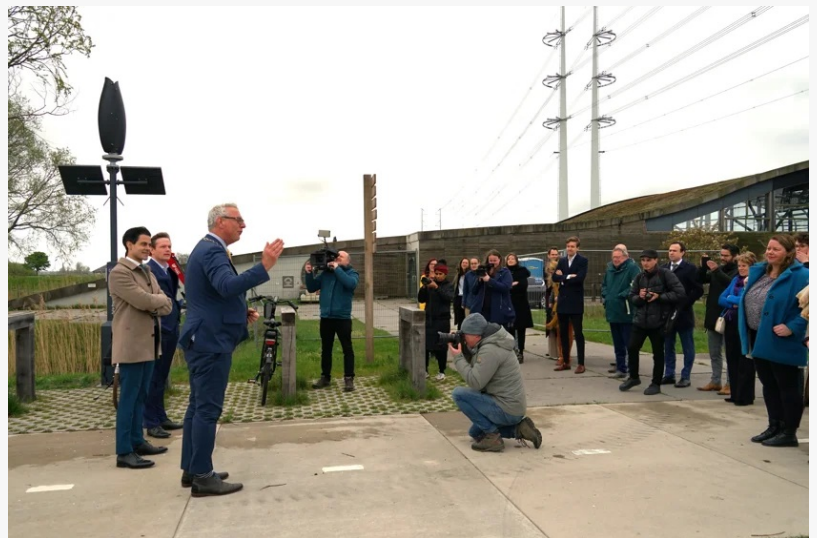
ZW Charging Station in Leiderdorps