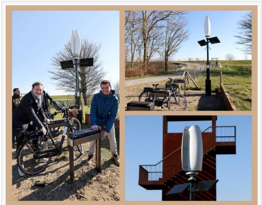
ZW Charging Station in Nissewaard

LinkedIn EU: https://www.linkedin.com/company/flower-turbines-bv