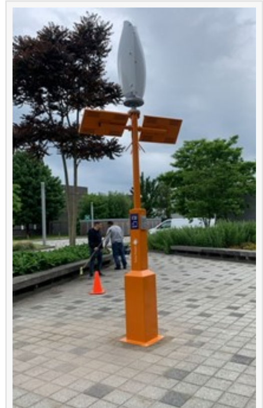
ZW Charging Station in Tilburg

This press release can be viewed online at: https://www.einpresswire.com/article/661060184