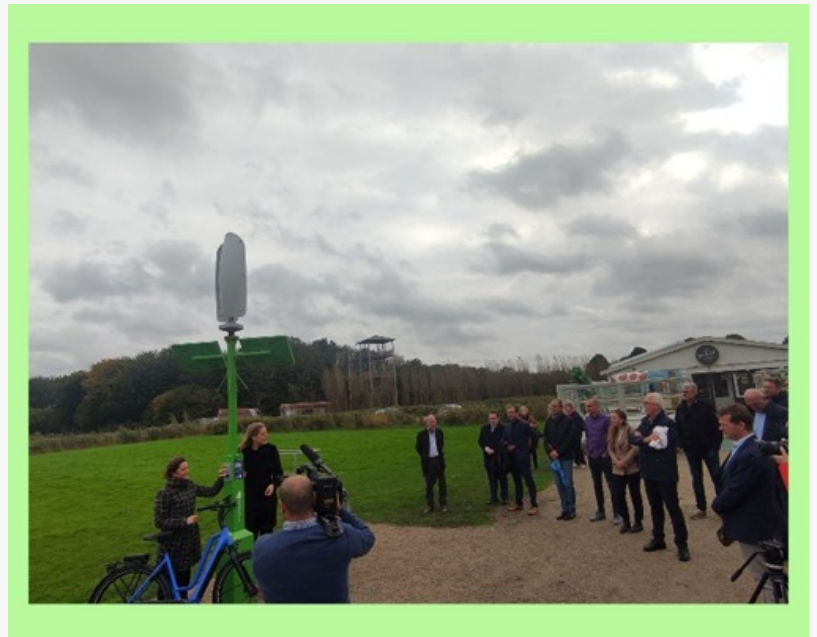
ZW Charging Station in Oostzaan