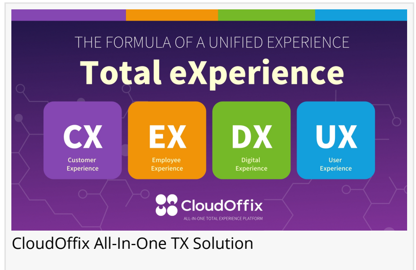
CloudOffix All-In-One TX Solution

RÜSSELSHEIM AM MAIN, HESSEN, GERMANY, November 9, 2023 /EINPresswire.com/ -- CloudOffix, als führende und innovative Lösung im Bereich der Total Experience , setzt weiterhin auf enge Bindungen mit ihren Partnern und Kunden bei renommierten Veranstaltungen.