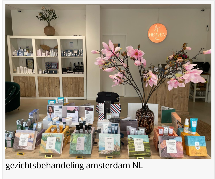
gezichtsbehandeling amsterdam NL

EINPresswire.com/ -- HEAVEN FOUR, een gerenommeerde wellnessstudio gelegen in het hart van Amsterdam Oost, kondigt met trots de lancering aan van haar nieuwste reeks anti-aging behandelingen en uitgebreide massagediensten. Deze innovatieve toevoegingen benadrukken de voortdurende toewijding van de salon aan hoge kwaliteit en gepersonaliseerde zorg voor zowel mannen als vrouwen.