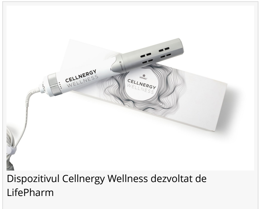
Dispozitivul Cellnergy Wellness dezvoltat de LifePharm

IRVINE, CA, USA, November 28, 2023 /EINPresswire.com/ -- LifePharm, lider în optimizarea celulelor stem, este încântată să prezinte Cellnergy Wellness , un dispozitiv de ultimă generație conceput pentru a spori abilitățile naturale de vindecare ale organismului prin eliberarea de celule stem. Combinând potențialul undelor terahertz cu eficacitatea terapiei cu lumină roșie și căldură, Cellnergy Wellness reprezintă un nou capitol în tehnologiile non-invazive de wellness.