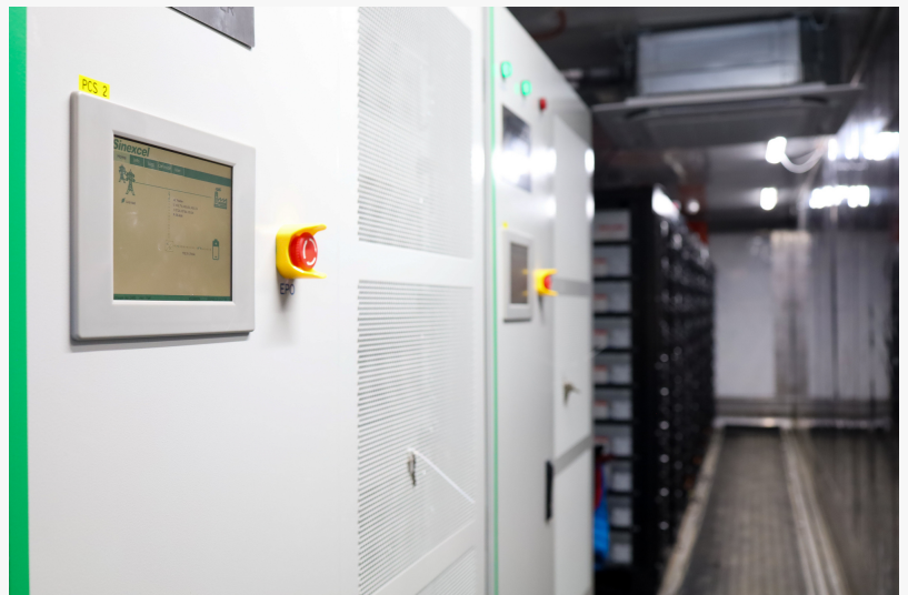
Wattstor battery energy storage system - an internal view of the container