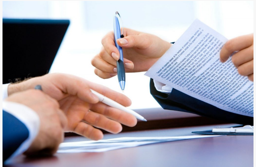
Apostilla Tampa Latina