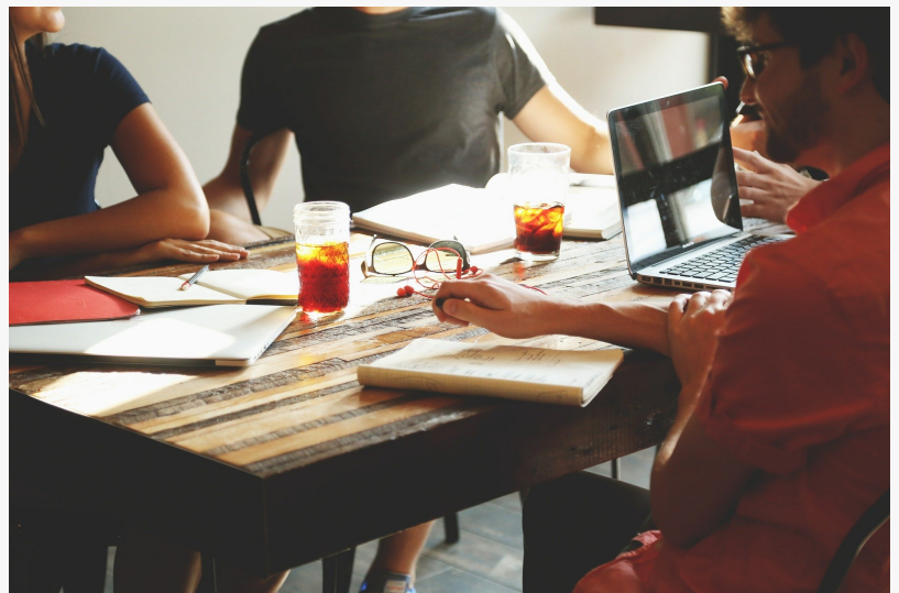
LEGALIZACION DOCUMENTOS CUBANOS

This press release can be viewed online at: https://www.einpresswire.com/article/694103671