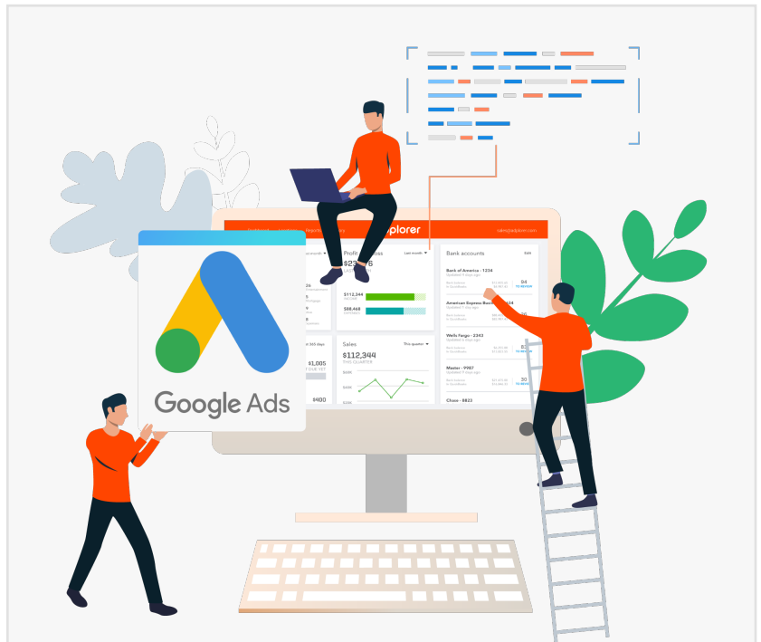
Google AdWords Agentur

zu generieren, kann eine gut verwaltete AdWords-Kampagne schneller den gewünschten Spitzenplatz in den Suchergebnissen erreichen. Unternehmen können AdWords nutzen, um Traffic und Leads schnell zu steigern. Darüber hinaus sorgt die Plattform für zusätzliche Transparenz und ermöglicht umfassende Einblicke in die Leistung und Wirksamkeit von