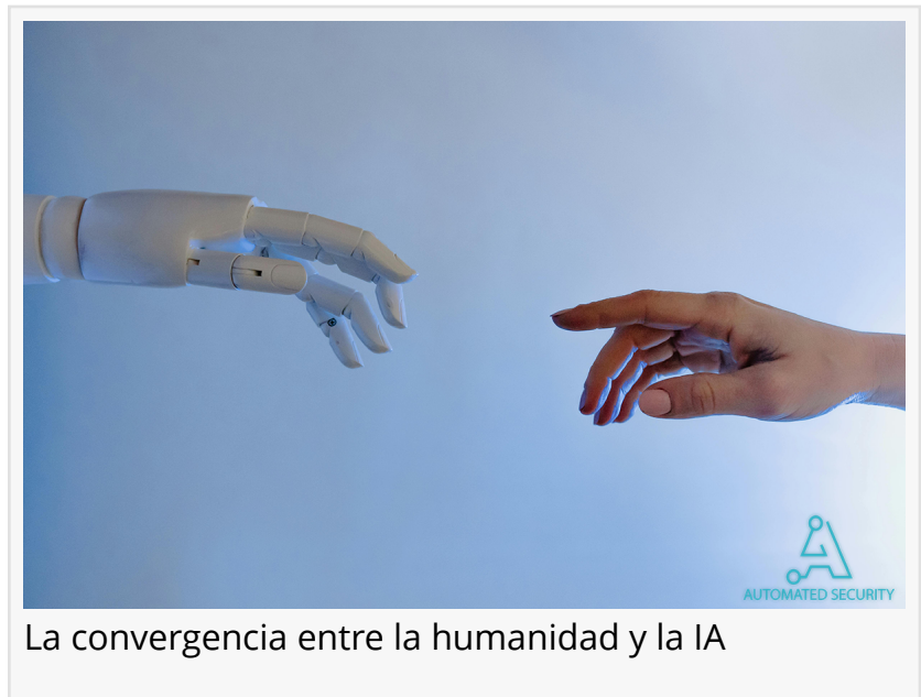
La convergencia entre la humanidad y la IA

En la industria manufacturera, la integración de sistemas de IA en líneas de producción está optimizando los procesos y reduciendo los costos de producción. Los algoritmos de IA pueden predecir y prevenir fallas en el equipo, optimizar la programación de la producción y mejorar la calidad del producto, lo que resulta en una mayor eficiencia y rentabilidad para las empresas.