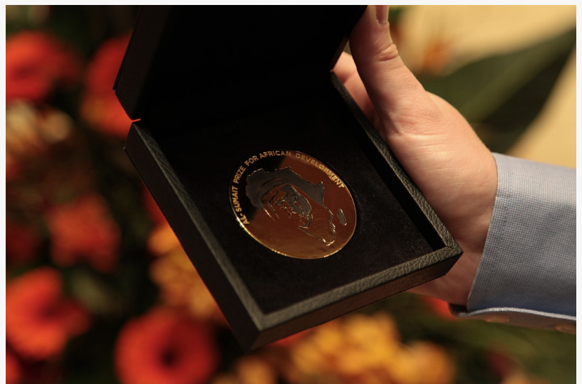
Image of the 2016 Al Sumait Awards Ceremony Gold Medal

https://www.alsumaitprize.org/candidaturas/?lang=pt-pt