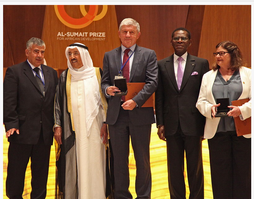
His Highness the late Emir of Kuwait with Dr Kevin Marsh at the 2016 Al Sumait Prize Ceremony

KUWAIT CITY, KUWAIT, April 18, 2024 /EINPresswire.com/ -- A Fundação do Kuwait para o Avanço das Ciências (KFAS) anuncia hoje o convite à apresentação de candidaturas para o Prémio Al Sumait de 2024 para o Desenvolvimento Africano no domínio da saúde. Este prestigiado prémio, avaliado em 1 milhão de dólares, é atribuído anualmente a indivíduos ou instituições que tenham feito contribuições significativas para o avanço de um dos três campos: saúde, segurança alimentar e educação em África.