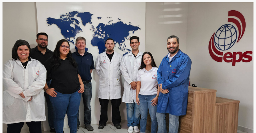
A equipa em São Paulo.

"Com esta expansão chave em Americana, São Paulo, nosso objetivo é trazer nossos serviços de Gravação de ICs e Provisionamento Seguro de classe mundial para mais perto de nossos clientes Tier 1, garantindo que continuemos a atender as suas necessidades de forma eficaz e eficiente."