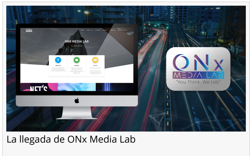
La llegada de ONx Media Lab