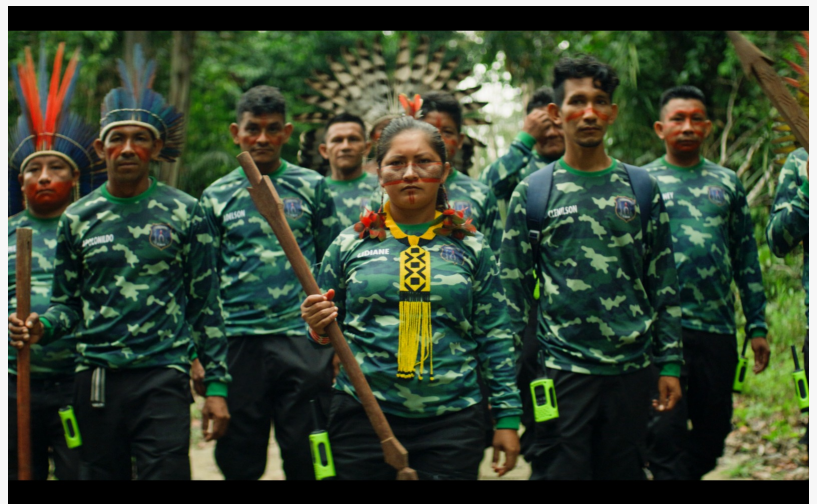
Maró Forest Guardians