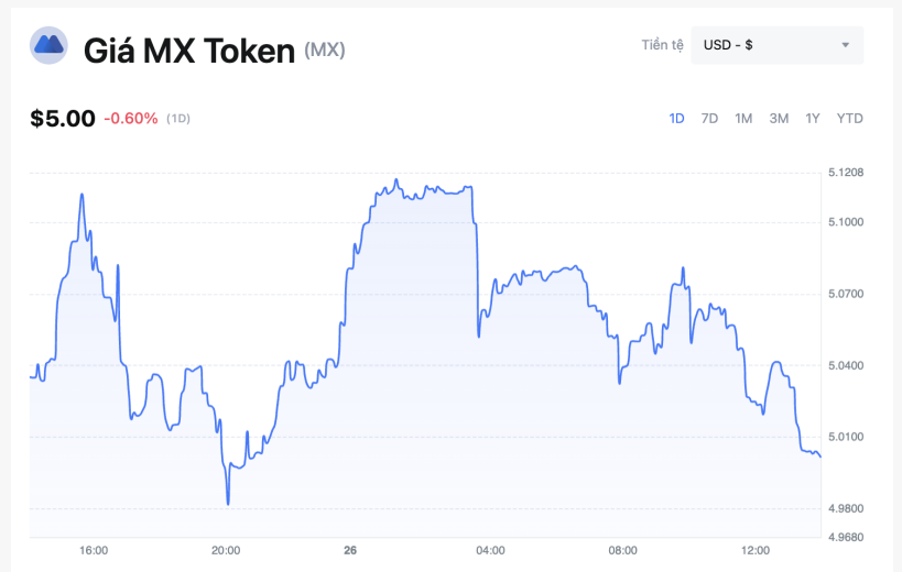
Giá MX Token