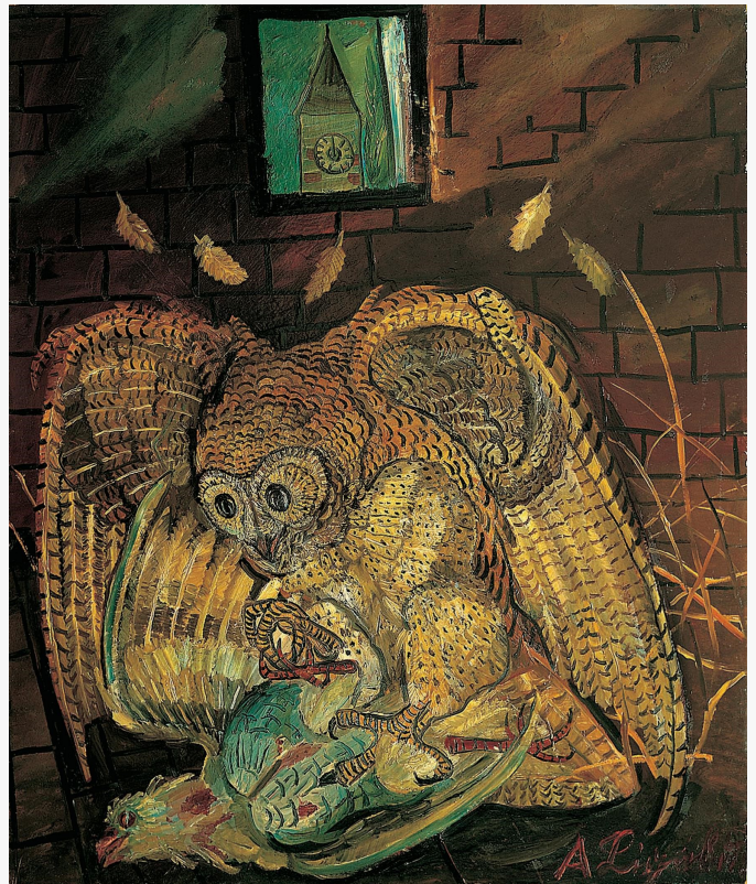
gufo che dilania una colomba collezione privata, 1951 cm 82x70 olio su faesite.