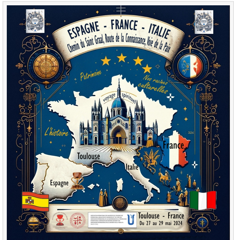
Le Chemin du Saint Graal, Route de la Connaissance, voie de la Paix