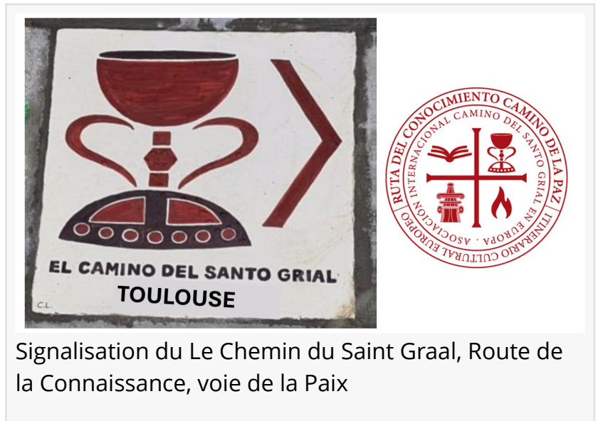
Signalisation du Le Chemin du Saint Graal, Route de la Connaissance, voie de la Paix

This press release can be viewed online at: https://www.einpresswire.com/article/714568437