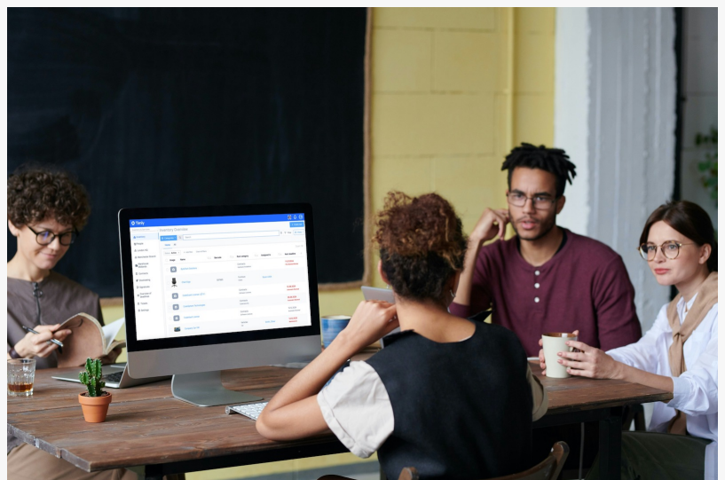
Employés d'Espoir Autisme Corse utilisant l'application de gestion d'inventaire Timly sur un ordinateur

La majorité des entreprises font face à des problèmes de gestion de matériel ; et les associations n'y échappent pas non plus. Faute d'une solution adaptée, cela signifie que le quotidien est plombé par des processus chronophages, du temps et des équipements perdus.