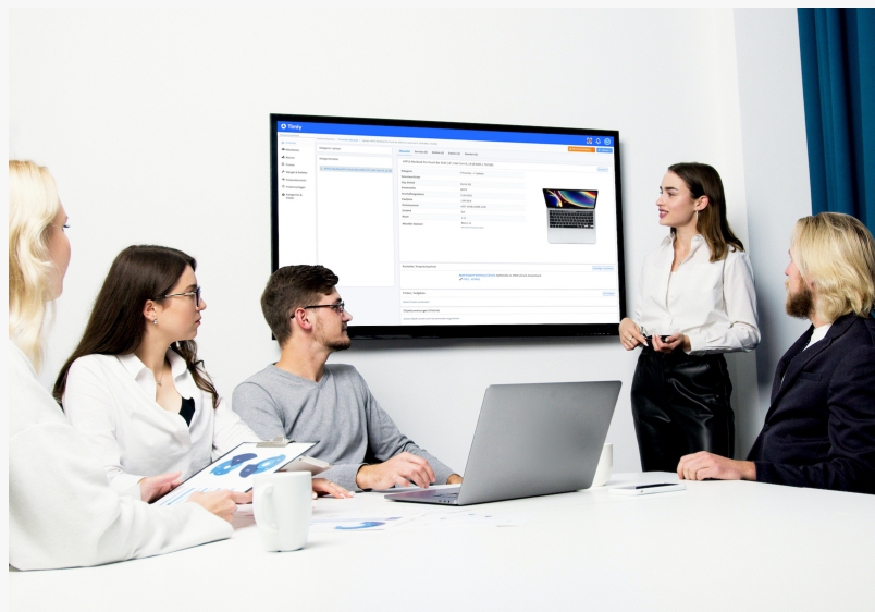
La plateforme de gestion d'inventaire Timly, avec GMAO et système de ticketing, plébiscitée par les employés