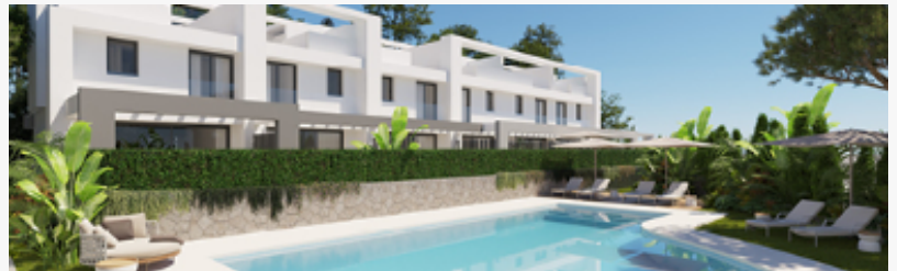
Sunny Hill Residences Chaparral