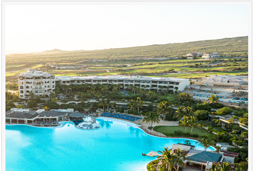
TAFER Hotels & Resorts Anuncia la apertura de Dos Resorts de Lujo y Residencias Excepcionales en Diamante Cabo San Lucas, México

607 hectáreas de la impresionante costa del Océano Pacífico y las majestuosas dunas en Baja California, México. Además, TAFER ha acordado asociarse con Diamante para ser propietario y operar los campos de golf Dunes Course, diseñado por Davis Love III y El Cardonal diseñado por TGR Design.