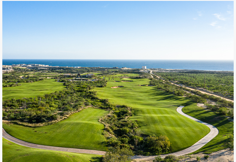
TAFER Hotels & Resorts Anuncia la apertura de Dos Resorts de Lujo y Residencias Excepcionales en Diamante Cabo San Lucas, México