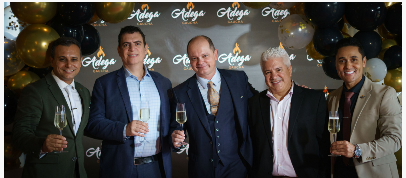
Nuestro equipo de Gerencia en Kissimmee