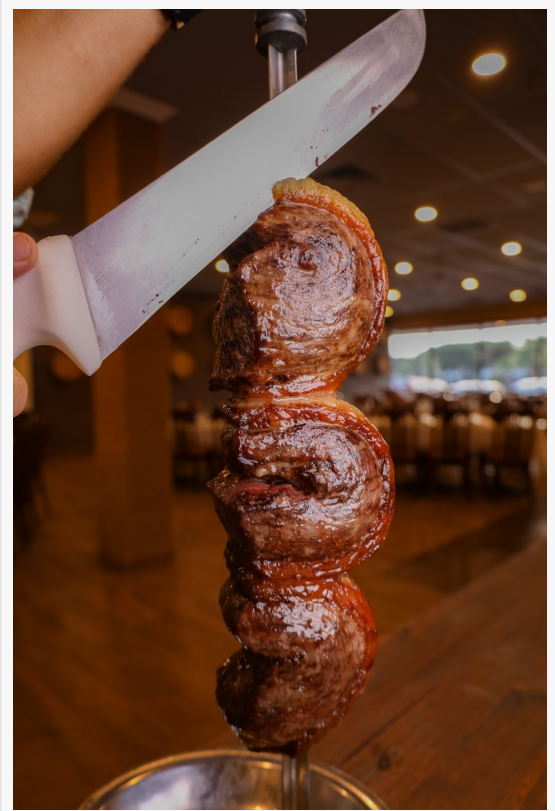
Picanha, el tradicional corte brasileiro

Mientras Adegas Gauchas Kissimmee celebra su exitosa inauguración, la sede original en Orlando festeja su tercer aniversario. Desde su apertura en 2021, Adegas Gauchas Orlando se ha consolidado como un referente culinario en Florida Central, siendo reconocida como la churrasquería mejor valorada de la ciudad y un destino gastronómico de primera para residentes y turistas.