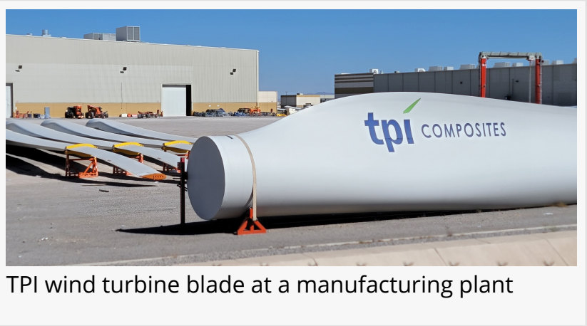
TPI wind turbine blade at a manufacturing plant

La balsa ( Ochroma pyramidale ) es nativa de las Américas y es conocida por sus cualidades increíblemente ligeras, duraderas y resistentes, lo que la hace muy deseable como material base en las palas de los aerogeneradores. La fabricación del núcleo de una pala de balsa requiere mezclar madera de árboles maduros (de 4 a 6 años) con la de árboles más jóvenes para lograr la mezcla crítica y precisa de densidad media de la madera requerida por los fabricantes de palas.