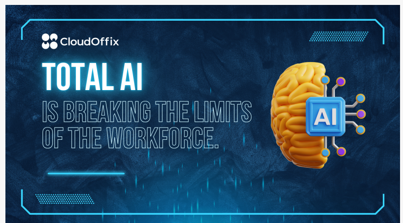
CloudOffix Total AI