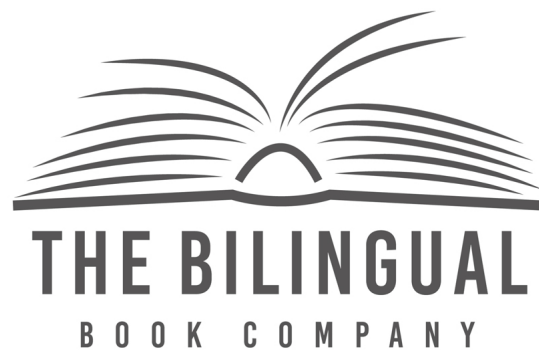
The Bilingual Book Company Logo