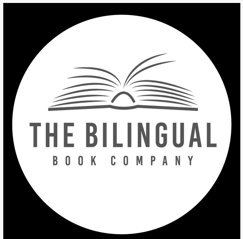
The Bilingual Book Company

Le selezioni di The Bilingual Book Company permettono ai bambini di scegliere un argomento affascinante e impararlo in due lingue, in modo che l’apprendimento linguistico non sia l’unico obiettivo. “Avendo una grande varietà di libri, i bambini non solo