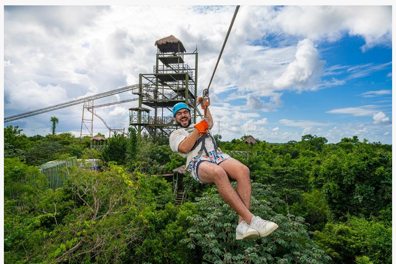
Selvatica Cancun The Adventure Tribe