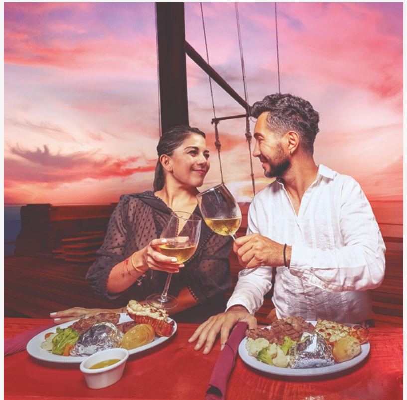
Aquatours Columbus Cena Romántica