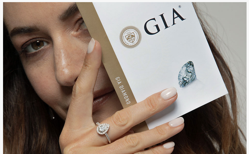
Diamant certifié GIA

Bijoux en ligne GV propose une large gamme de bijoux en or pour femme et homme : bagues, colliers, bracelets, boucles d'oreilles, et plus encore. Des bagues de fiançailles aux alliances en passant par les bijoux de tous les jours, chaque pièce est conçue pour refléter une élégance intemporelle.