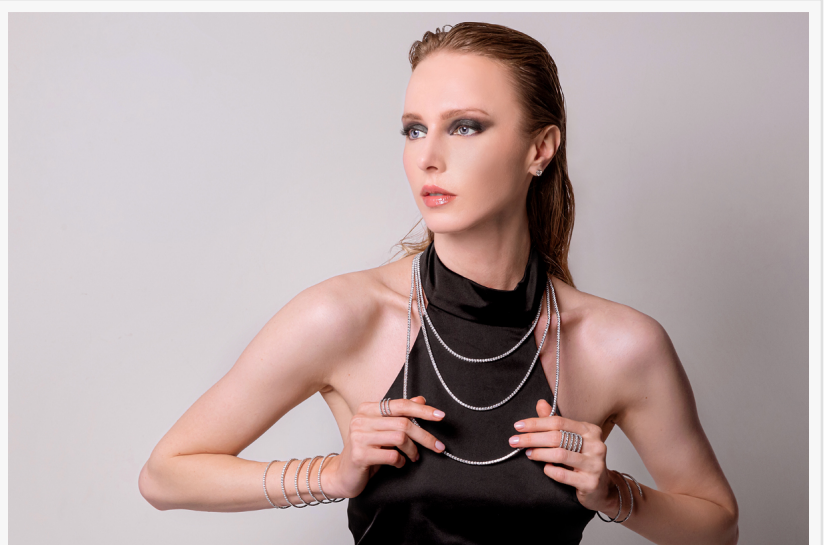
La bijouterie en ligne Bijoux GV

FRANCE, November 27, 2024 /EINPresswire.com/ -- Bijoux GV s'est imposé comme une destination pour les amateurs de bijoux de qualité à des prix attractifs. Cette boutique en ligne, fondée dans la ville de Valenza, symbole de la tradition joaillière italienne, propose une gamme exceptionnelle de bijoux en or 18 carats pour hommes et femmes, alliant artisanat traditionnel et design contemporain.