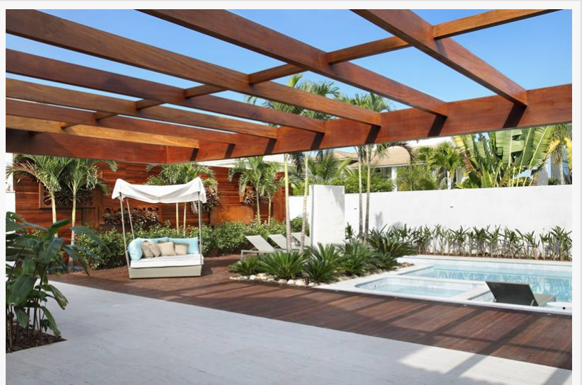
Projeto Residencial por Leila Dionizios Arquitetura

Com sua metodologia inovadora e sua especialização à frente de um escritório de arquitetura de luxo na Barra da Tijuca Leila Dionizios tem se destacado cada vez mais no mercado, realizando diversos projetos de design de interiores e conquistando clientes e admiradores em todo o país.