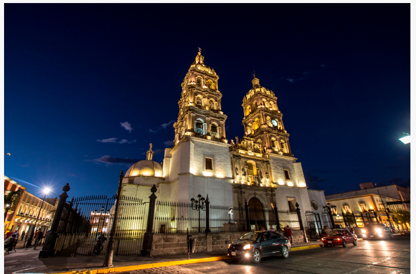
Vive la Historia y Cultura de Durango

SPRING, TX, UNITED STATES, January 9, 2025 /EINPresswire.com/ -- Durango, México – Un destino donde la historia, la cultura y la magia del cine se entrelazan. Este estado del norte de México, conocido como “La Tierra del Cine”, se ha convertido en un imán para los amantes de la naturaleza, la aventura y la cinematografía. Con su rica herencia cultural, sus paisajes únicos y su deliciosa gastronomía, Durango invita a los viajeros a explorar un destino lleno de experiencias inolvidables.