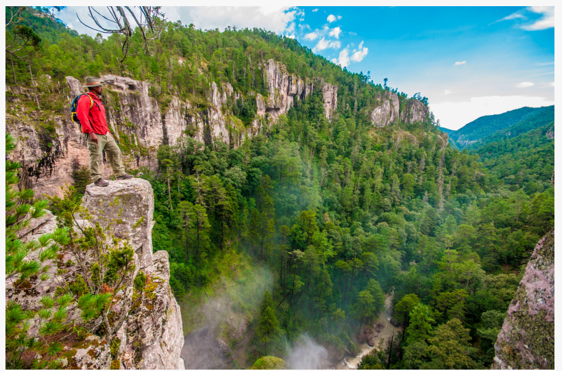
Vive la Naturaleza de Durango