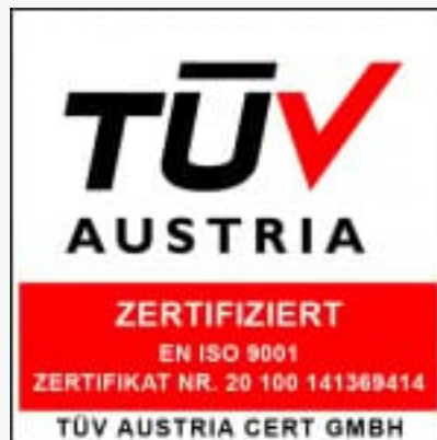
ISO 9001 Certification