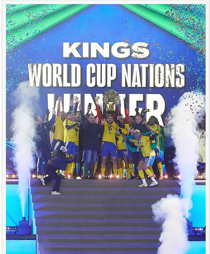
Brazil celebrates victory in the Kings League World Cup 2025, setting a new milestone in global 7-a-side football history.