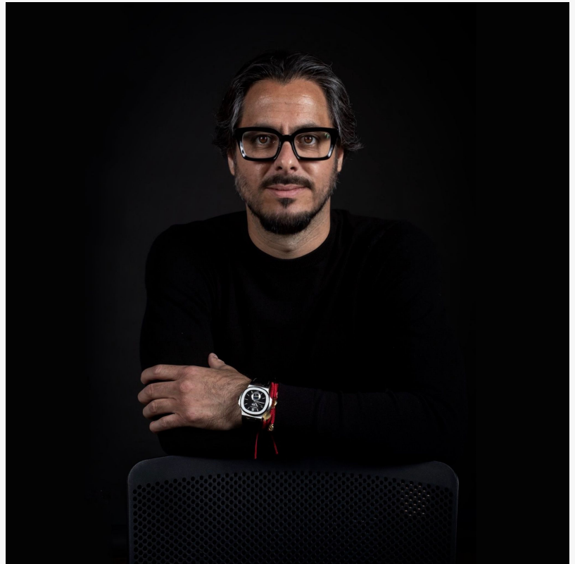
Cahero Family Office fortalece su presencia en España con inversiones estratégicas en sectores clave.

España se ha convertido en un mercado estratégico para Cahero Family Office, con Marbella como punto de referencia clave para sus futuras inversiones. La firma mantiene un enfoque en sectores financieros esenciales como la banca, las asociaciones público-privadas y la gestión de activos, además de analizar proyectos respaldados por el gobierno que contribuyan a la