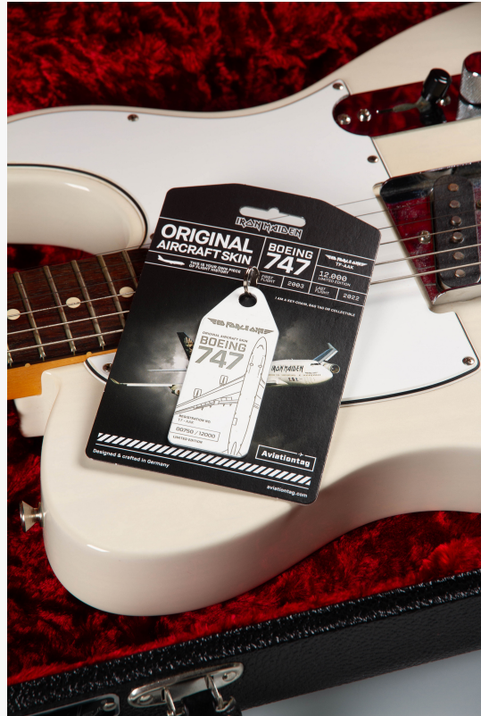
Mood Bild des Aviationtag x Iron Maiden Tags

Für weitere Informationen besuchen Sie bitte www.aviationtag.com/ironmaiden .