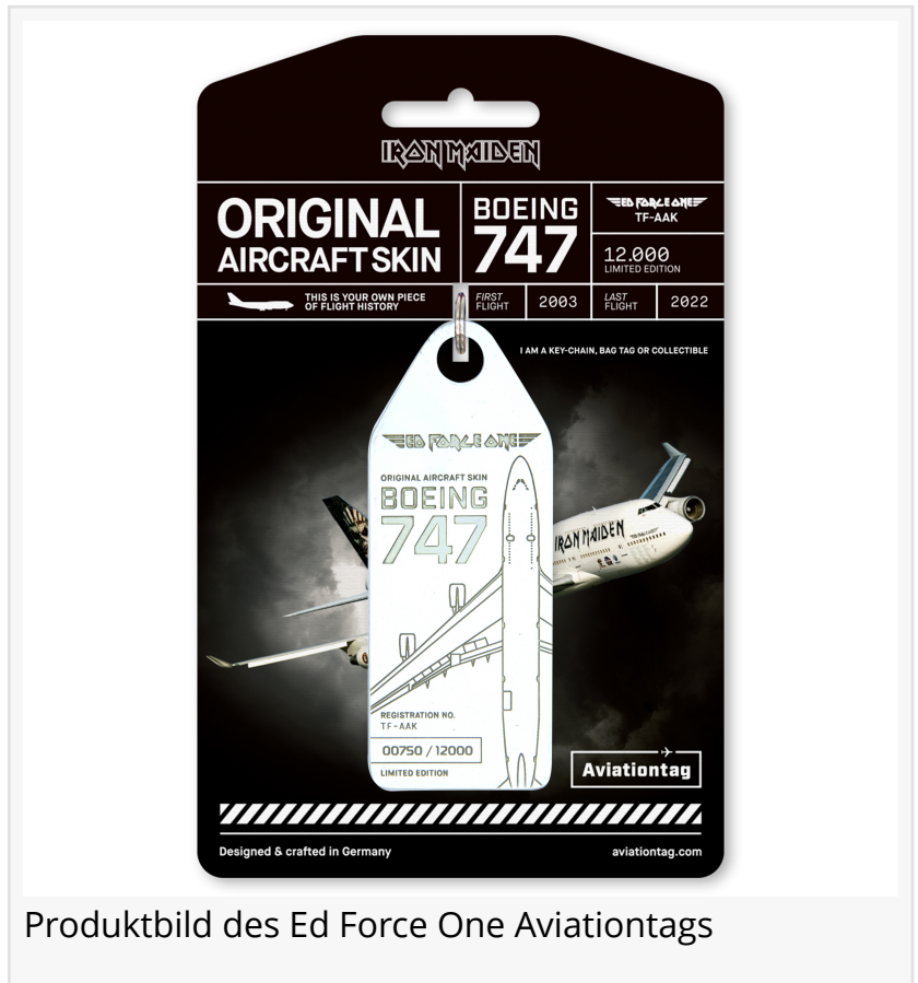
Produktbild des Ed Force One Aviationtags

„Sie hat sich immer wie die Königin der Lüfte verhalten, die die 747 immer sein wird. Es wird nie eine andere geben, die ihren Thron besetzt. Die Kraft, der Lärm der vier Triebwerke, die federleichten Landungen (nicht mein