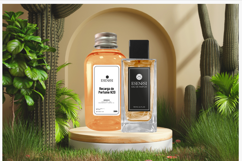
2 - Esenssi Aromas S.L. – Crea tu propio empleo

Esenssi Aromas SL - Especialistas en negocios de perfumería.