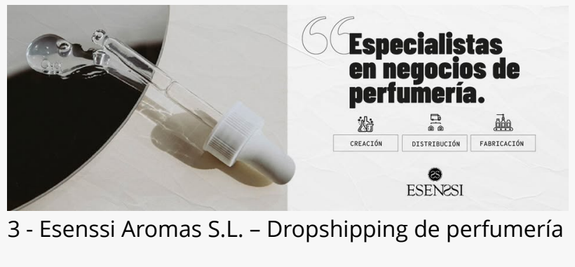
3 - Esenssi Aromas S.L. – Dropshipping de perfumería