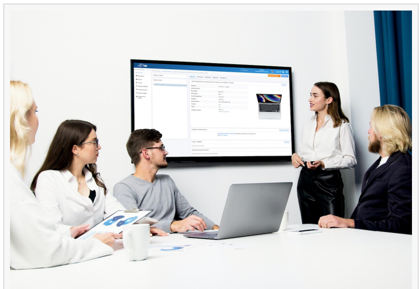
El software de gestión de inventarios de Timly es utilizado por cientos de empresas

“Hemos desarrollado Timly para resolver un problema real: la gestión de inventarios