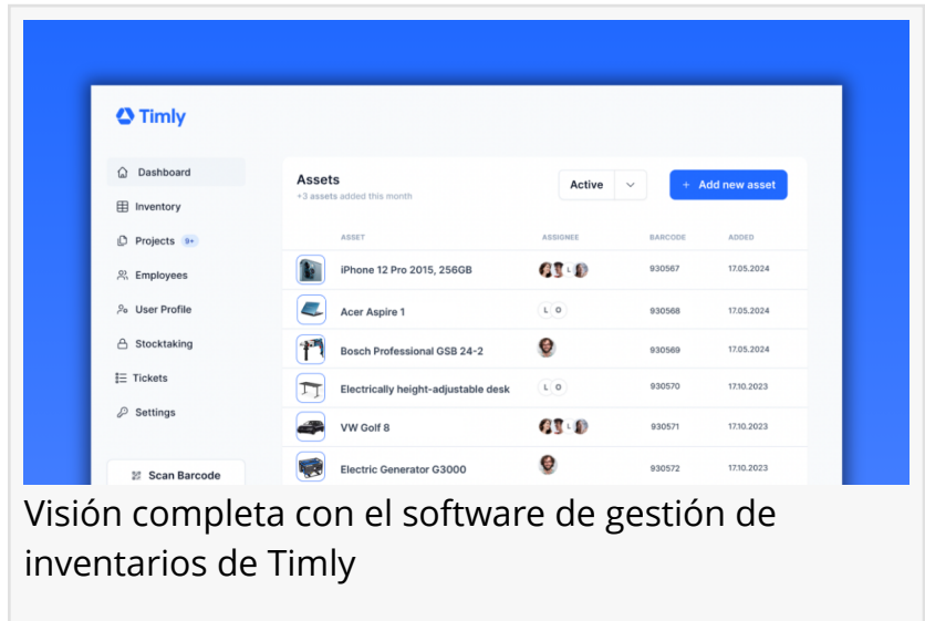
Visión completa con el software de gestión de inventarios de Timly

ZÜRICH, ZH, SWITZERLAND, September 8, 2025 /EINPresswire.com/ -- Timly, un proveedor líder de soluciones inteligentes para la gestión de inventarios , ayuda a empresas de diversos sectores a gestionar sus activos de forma digital y eficiente.