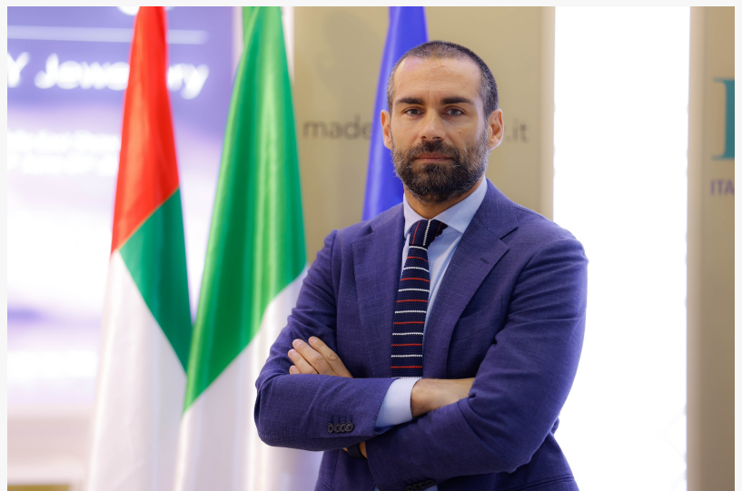
Trade Commissioner, ITA

DUBAI, DUBAI WORLD TRADE CENTRE, UNITED ARAB EMIRATES, October 27, 2025 /EINPresswire.com/ -- 2025 161 2025