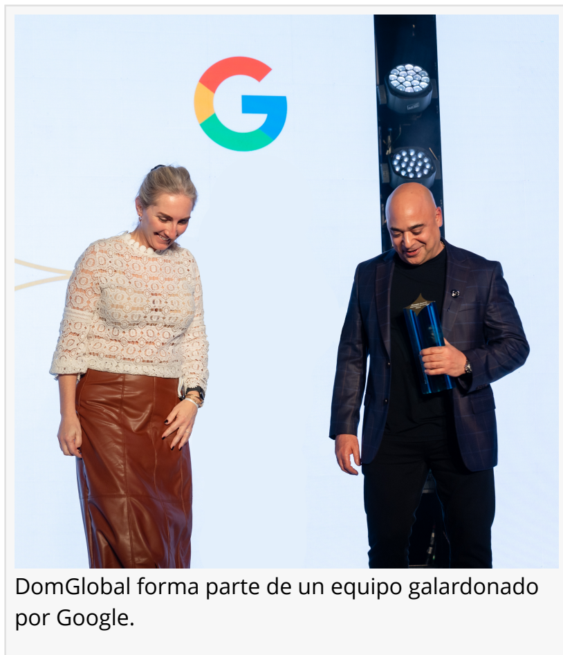
DomGlobal forma parte de un equipo galardonado por Google.