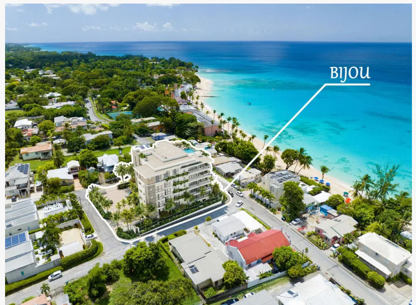
Brand New Bijou Residences - Steps from the Beach