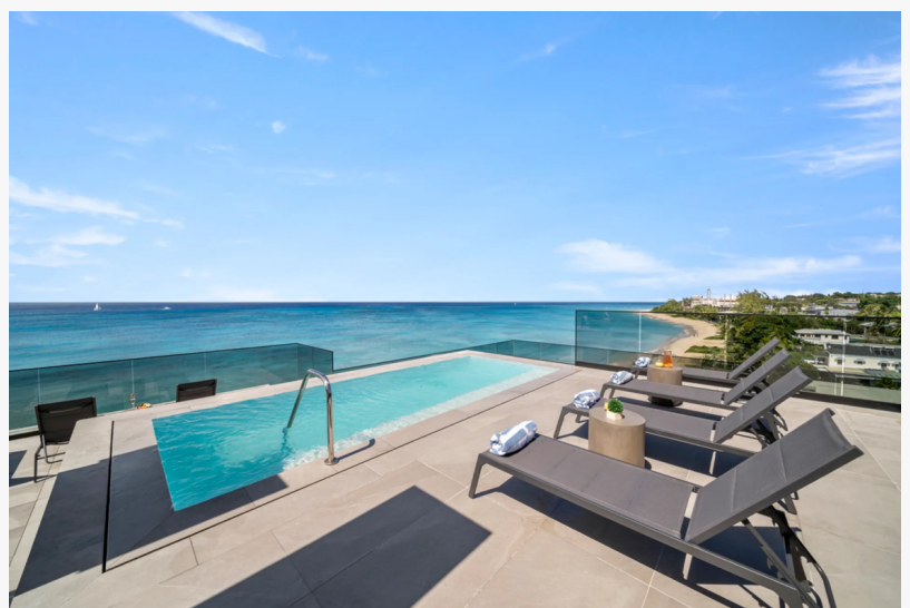
Allure Beachfront Residence