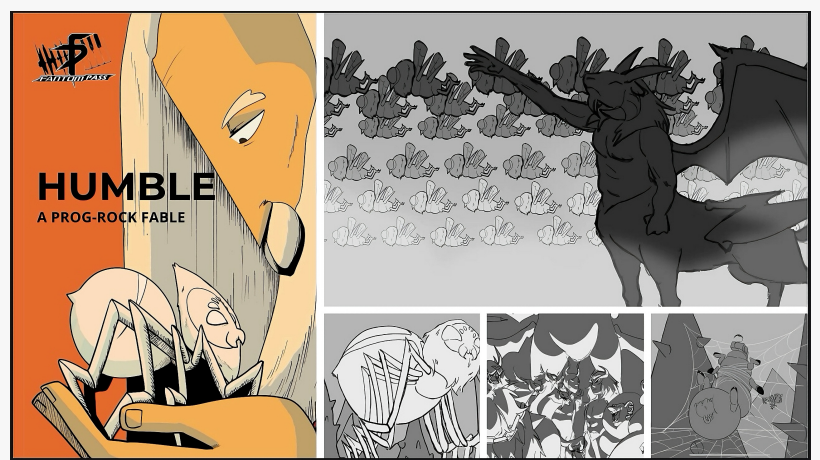
Ilustración de HUMBLE, el storyboard musical animado de Fantompass, diseñado por la artista conceptual Alex González Scollo de L'idem Animation School, Barcelona.

Su música se caracteriza por estructuras extensas, métricas complejas y una amplia paleta instrumental que integra flauta, saxofón y handpans, combinando profundidad melódica con