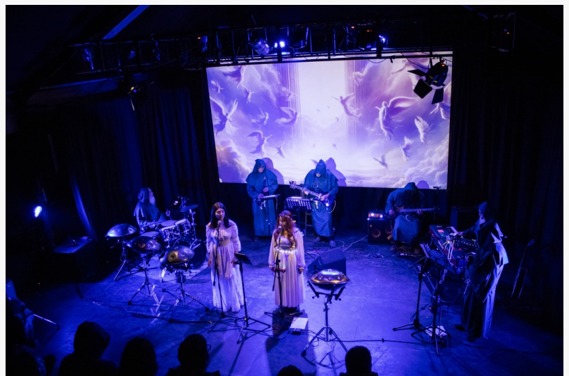
Fantompass presenta "Gates of Glory" en vivo en Concepción, Chile. El conjunto de nueve integrantes combina rock progresivo, puesta en escena conceptual y narrativa visual en una experiencia inmersiva en vivo.

Tras la sección vocal, la música se despliega en un viaje instrumental dramático que evoca una vida eremítica en un bosque frío y solitario, donde el protagonista se encuentra con un ciervo luminoso, símbolo de la Divinidad cristiana.