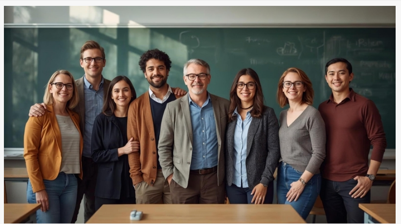
Plag eliminerer kostnadsbarrierer for akademisk integritet

Plag, en ledende flerspråklig plagiat- og AI-deteksjonsplattform, kunngjorde i dag at alle premiumtjenester nå er gratis for verifiserte lærere over hele verden. Initiativet gir lærere, forelesere og professorer profesjonell plagiatkontroll, AI-innholdsdeteksjon , oversatt plagiatdeteksjon på tvers av språk og tilgang til en database med over 100 millioner vitenskapelige artikler uten kostnad.