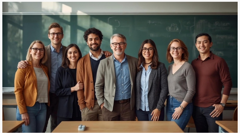
Plag fjerner omkostningsbarrierer for akademisk integritet