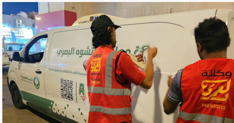
الهيئة العامة للغذاء والدواء الهيئة العامة للغذاء والدواء

This press release can be viewed online at: https://www.einpresswire.com/article/891085326