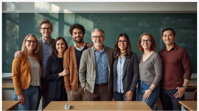
Plag Elimina las Barreras de Costo para la Integridad Académica